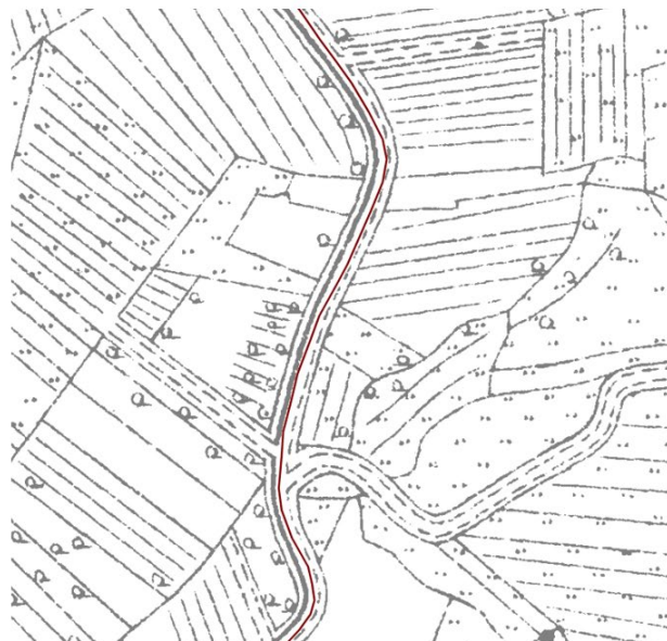
Aus dem Preußischen Messtischblatt (unten) abgeleiteter Verlauf des Hörstendeichs